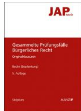
JAP - Gesammelte Prüfungsfälle Bürgerliches Recht Ladenpreis: 36,00EUR