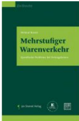
Mehrstufiger Warenverkehr Ladenpreis: 68,00EUR