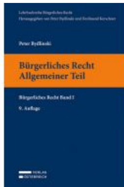
Bürgerliches Recht I. Allgemeiner Teil Ladenpreis: 33,00EUR