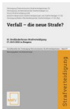
Verfall - die neue Strafe? Ladenpreis: 58,00EUR