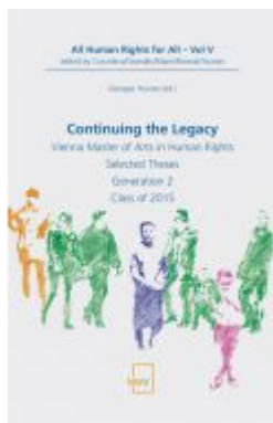
Continuing the Legacy Ladenpreis: 58,00EUR