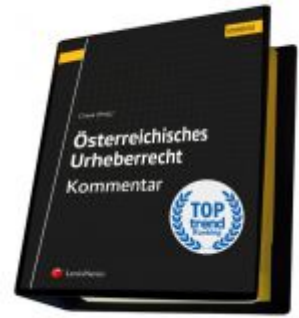
Österreichisches Urheberrecht Ladenpreis: 229,00EUR