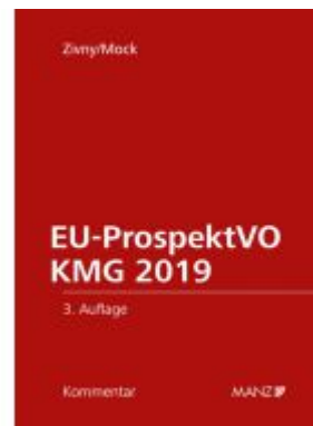
EU-ProspektVO/KMG 2019 Ladenpreis: 148,00EUR