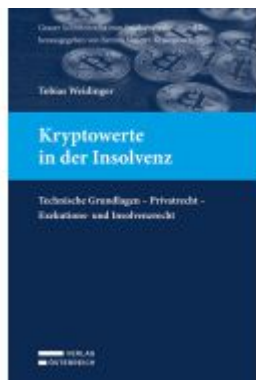
Kryptowerte in der Insolvenz Ladenpreis: 89,00EUR

Wir haben andere Produkte gefunden, die Ihnen gefallen könnten!