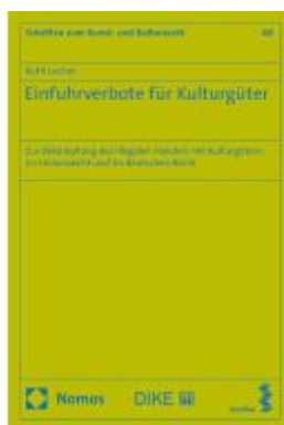
Einfuhrverbote für Kulturgüter Ladenpreis: 199,50EUR