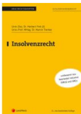
Insolvenzrecht Ladenpreis: 26,25EUR