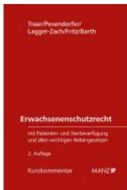
Erwachsenenschutzrecht Ladenpreis: 148,00EUR