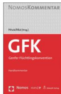
Genfer Flüchtlingskonvention Ladenpreis: 128,00EUR

Alle Preise inkl. MwSt. zzgl. Versand. Bei Bestellung im LexisNexis Onlineshop kostenloser Versand innerhalb Österreichs.