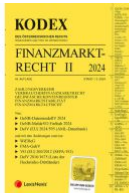
KODEX Finanzmarktrecht Band II 2024 - inkl. App Ladenpreis: 90,00EUR