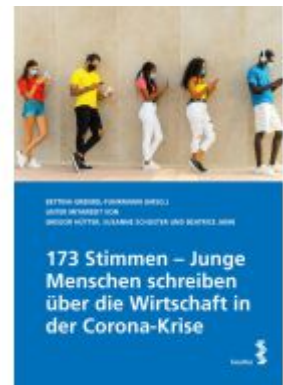
173 Stimmen - Junge Menschen schreiben über die Wirtschaft in der Corona-Krise Ladenpreis: 12,00EUR