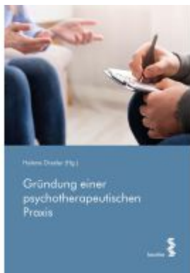
Gründung einer psychotherapeutischen Praxis Ladenpreis: 24,90EUR