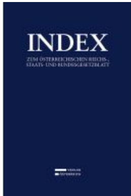
Index Ladenpreis: 499,00EUR