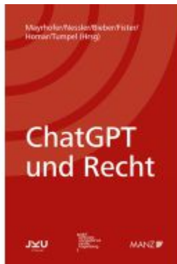
ChatGPT, Gemini & Co: Große Sprachmodelle und Recht Ladenpreis: 48,00EUR