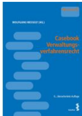
Casebook Verwaltungsverfahrenrecht Ladenpreis: 34,00EUR