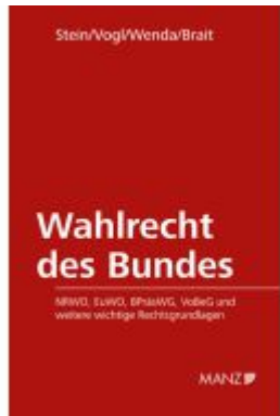
Wahlrecht des Bundes Ladenpreis: 138,00EUR