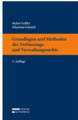
Grundlagen und Methoden des Verfassungs- und Verwaltungsrechts Ladenpreis: 32,00EUR