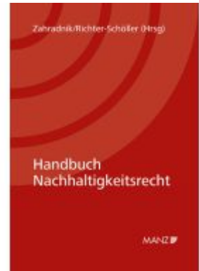
Handbuch Nachhaltigkeitsrecht Ladenpreis: 78,00EUR