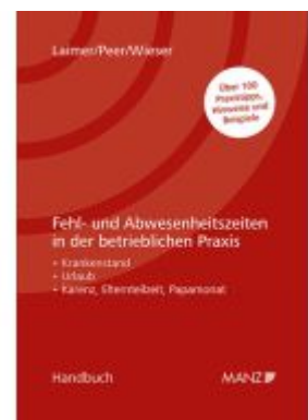
Fehl- und Abwesenheitszeiten in der betrieblichen Praxis Ladenpreis: 52,00EUR