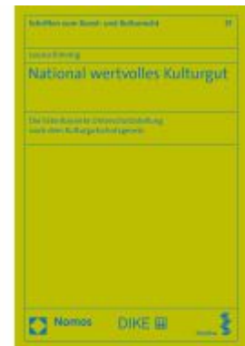
National wertvolles Kulturgut Ladenpreis: 139,90EUR