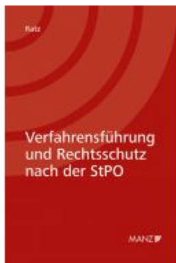
Verfahrensführung und Rechtsschutz nach der StPO Ladenpreis: 98,00 EUR

Wir haben andere Produkte gefunden, die Ihnen gefallen könnten!