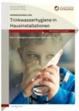
Normensammlung Trinkwasserhygiene in Hausinstallationen Ladenpreis: 174,90 EUR