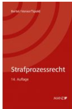
Strafprozessrecht Ladenpreis: 38,00 EUR