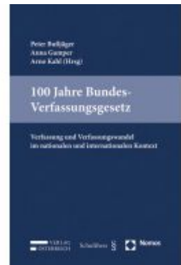
100 Jahre Bundes-Verfassungsgesetz Ladenpreis: 49,00 EUR