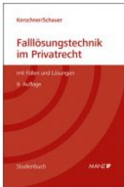
Falllösungstechnik im Privatrecht Mit Fällen und Lösungen Ladenpreis: 39,00 EUR