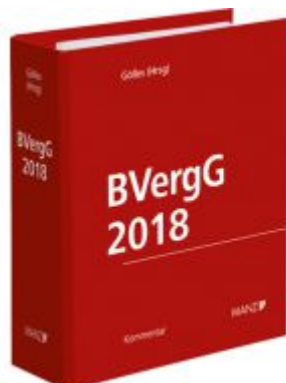
BVerfGG 2018 Ladenpreis: 258,00 EUR