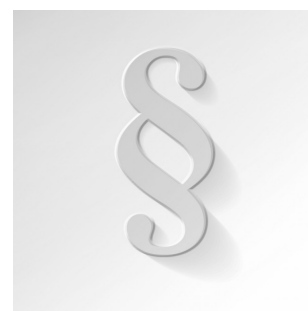
Religiöse Vielfalt in Österreich Ladenpreis: 40,00 EUR