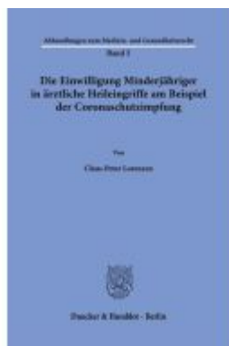
Die Einwilligung Minderjähriger in ärztliche Heileingriffe am Beispiel der Coronaschutzimpfung. Ladenpreis: 61,60EUR