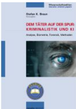
Dem Täter auf der Spur: Kriminalistik und KI Ladenpreis: 30,90EUR