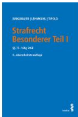
Strafrecht Besonderer Teil I Ladenpreis: 50,00EUR

Wir haben andere Produkte gefunden, die Ihnen gefallen könnten!