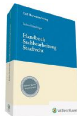
Handbuch Sachbearbeitung Strafrecht Ladenpreis: 50,40EUR