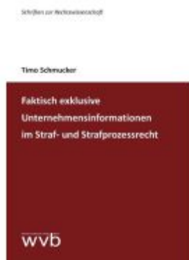
Faktisch exklusive Unternehmensinformationen im Straf- und Strafprozessrecht Ladenpreis: 44,30EUR