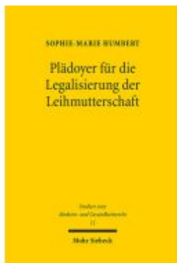
Plädoyer für die Legalisierung der Leihmutterschaft Ladenpreis: 107,00EUR