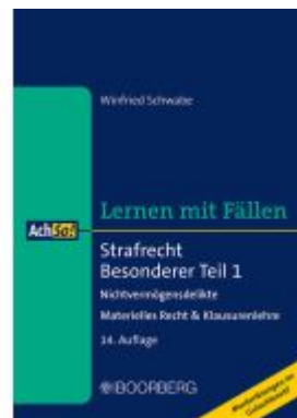
Strafrecht Besonderer Teil 1 Ladenpreis: 23,20EUR