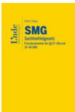
SMG | Suchtmittelgesetz Ladenpreis: 32,00EUR