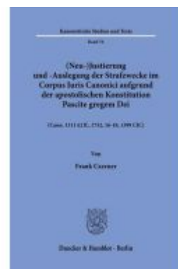
(Neu-)Justierung und -Auslegung der Strafzwecke im Corpus Iuris Canonici aufgrund der apostolischen Konstitution Pascite gregem Dei. Ladenpreis: 51,30EUR