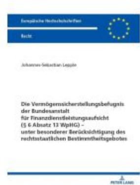
Die Vermögenssicherstellungsbefugnis der Bundesanstalt für Finanzdienstleistungsaufsicht (§ 6 Absatz 13 WpHG) – unter besonderer Berücksichtigung des rechtsstaatlichen Bestimmtheitsgebotes Ladenpreis: 46,20EUR