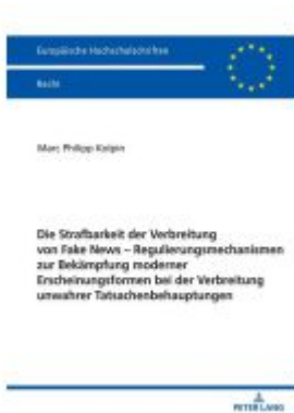
Die Strafbarkeit der Verbreitung von Fake News – Regulierungsmechanismen zur Bekämpfung moderner Erscheinungsformen bei der Verbreitung unwahrer Tatsachenbehauptungen Ladenpreis: 113,10EUR