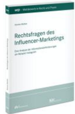
Rechtsfragen des Influencer-Marketings Ladenpreis: 91,50EUR