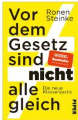
Vor dem Gesetz sind nicht alle gleich Ladenpreis: 14,40EUR