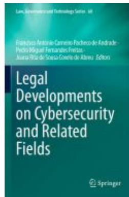
Legal Developments on Cybersecurity and Related Fields Ladenpreis: 186,99EUR