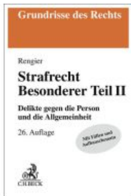
Strafrecht Besonderer Teil II Ladenpreis: 29,80EUR