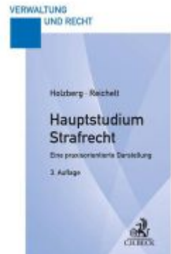
Hauptstudium Strafrecht Ladenpreis: 27,70EUR