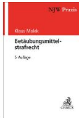
Betäubungsmittelstrafrecht Ladenpreis: 81,30EUR