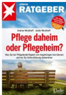
Pflege daheim oder Pflegeheim? Ladenpreis: 9,90 EUR