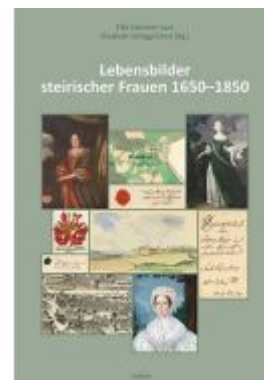
Lebensbilder steirischer Frauen 1650-1850 Ladenpreis: 29,90 EUR