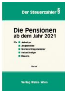
Die Pensionen ab dem Jahr 2021 Ladenpreis: 47,30 EUR