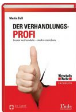
Der Verhandlungs-Profi Ladenpreis: 24,90 EUR