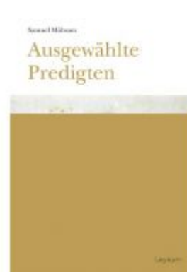
Samuel Mühsam. Ausgewählte Predigten Ladenpreis: 18,00 EUR