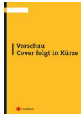
BAO 2020/2021 Ladenpreis: 50,00 EUR