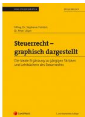
Steuerrecht - graphisch dargestellt (Skriptum) Ladenpreis: 22,00 EUR