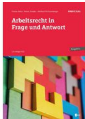
Arbeitsrecht in Frage und Antwort Ladenpreis: 39,00EUR