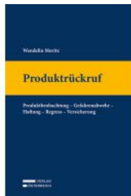
Produktrückruf Ladenpreis: 129,00EUR