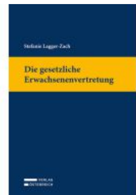
Die gesetzliche Erwachsenenvertretung Ladenpreis: 79,00EUR