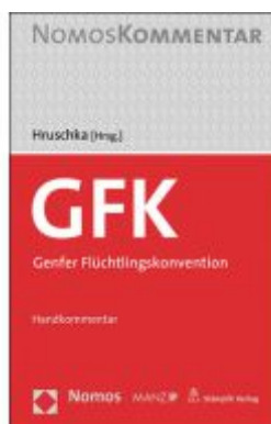
Genfer Flüchtlingskonvention Ladenpreis: 128,00EUR