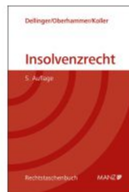
Insolvenzrecht Ladenpreis: 48,00EUR