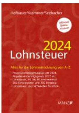
Lohnsteuer 2024 Ladenpreis: 66,00EUR