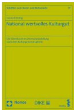
National wertvolles Kulturgut Ladenpreis: 139,90EUR