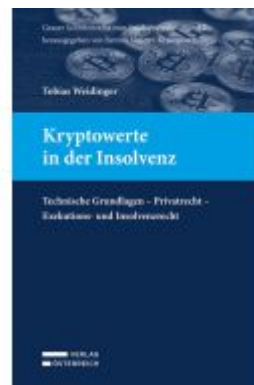
Kryptowerte in der Insolvenz Ladenpreis: 89,00EUR