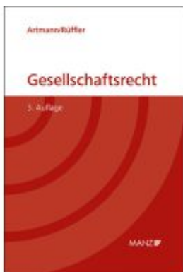
Gesellschaftsrecht Ladenpreis: 79,80EUR