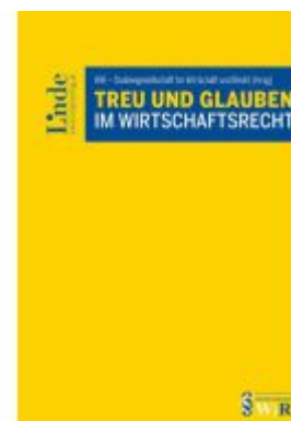
Treu und Glauben im Wirtschaftsrecht Ladenpreis: 62,00EUR