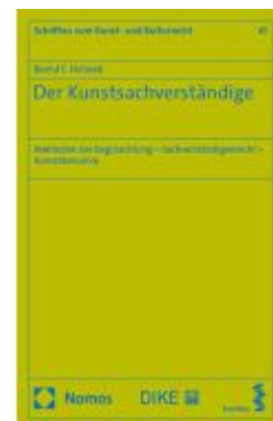
Der Kunstsachverständige Ladenpreis: 142,90EUR