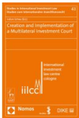
Creation and Implementation of a Multilateral Investment Court Ladenpreis: 91,50EUR