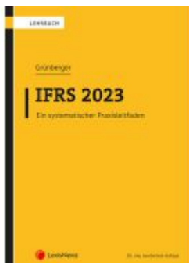
IFRS 2023 Ladenpreis: 48,00EUR

Wir haben andere Produkte gefunden, die Ihnen gefallen könnten!