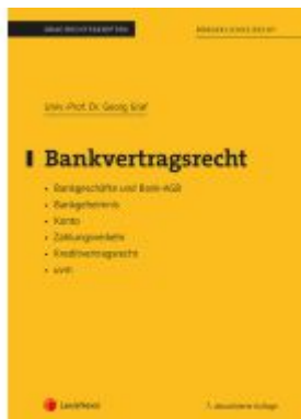
Bankvertragsrecht (Skriptum) Ladenpreis: 29,00EUR