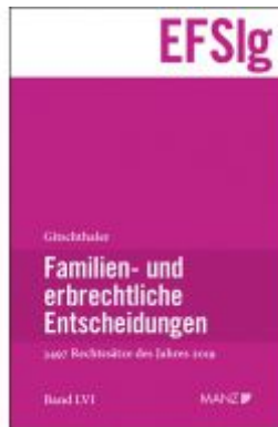
Familien- und erbrechtliche Entscheidungen EF-Slg Ladenpreis: 240,00 EUR