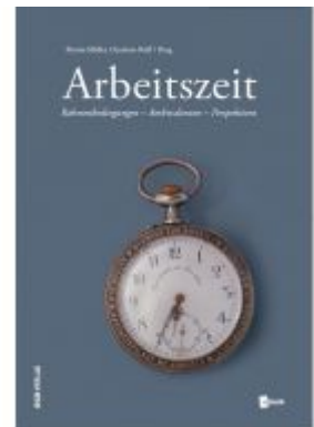
Arbeitszeit Ladenpreis: 36,00 EUR