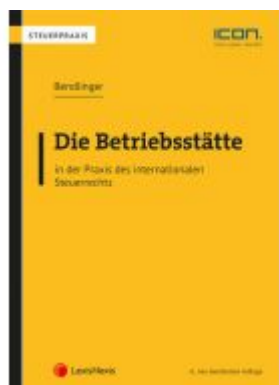
Die Betriebsstätte in der Praxis des internationalen Steuerrechts Ladenpreis: 86,00 EUR