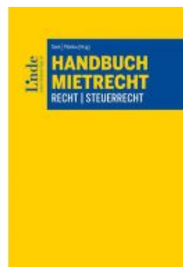
Handbuch Mietrecht Ladenpreis: 160,00 EUR