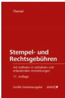
Stempel- und Rechtsgebühren Ladenpreis: 138,00 EUR