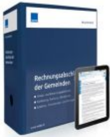
Rechnungsabschluss der Gemeinden Ladenpreis: 207,90 EUR