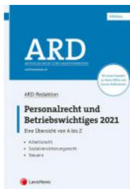
Personalrecht und Betriebswichtiges 2021 Ladenpreis: 80,00 EUR