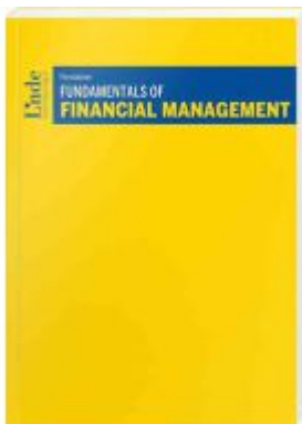
Fundamentals of Financial Management Ladenpreis: 26,00EUR