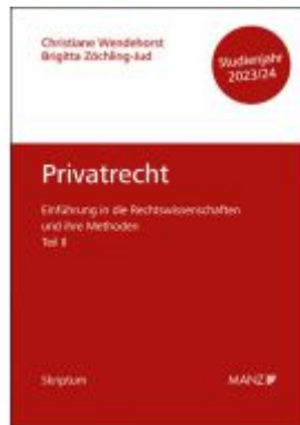
Privatrecht Einführung in die Rechtswissenschaften und ihre Methoden: Teil II Ladenpreis: 15,40EUR