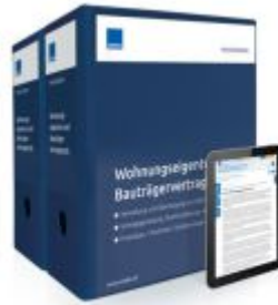
Wohnungseigentum und Bauträgervertragsrecht Ladenpreis: 261,80EUR