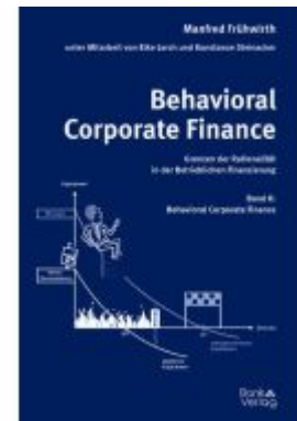
Behavioral Corporate Finance - Grenzen der Rationalität in der Betrieblichen Finanzierung Ladenpreis: 74,00EUR