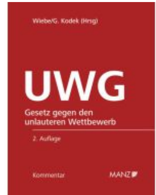
Kommentar zum UWG 2. Auflage Ladenpreis: 328,00EUR