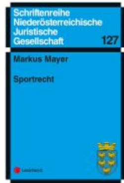
Sportrecht Ladenpreis: 11,00EUR