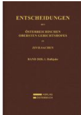
Entscheidungen des Obersten Gerichtshofes in Zivilsachen Ladenpreis: 186,00EUR