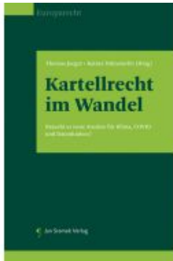
Kartellrecht im Wandel Ladenpreis: 78,00EUR

Wir haben andere Produkte gefunden, die Ihnen gefallen könnten!