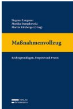
Maßnahmenvollzug Ladenpreis: 119,00EUR