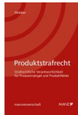
Produktstrafrecht Strafrechtliche Verantwortlichkeit für Produktmängel und Produktfehler Ladenpreis: 104,00EUR