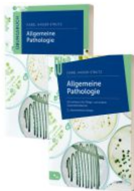
Lernpaket Allgemeine Pathologie Ladenpreis: 41,90EUR