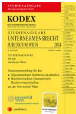
KODEX Unternehmensrecht Wien Juridicum 2024 - inkl. App Ladenpreis: 28,00EUR