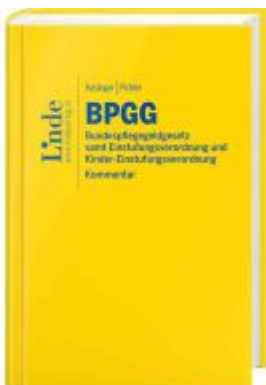
BPGG | Bundespflegegeldgesetz Ladenpreis: 59,00EUR