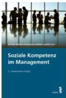
Soziale Kompetenz im Management Ladenpreis: 35,00EUR