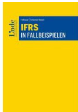
IFRS in Fallbeispielen Ladenpreis: 58,00EUR