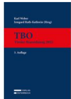
TBO Ladenpreis: 299,00EUR