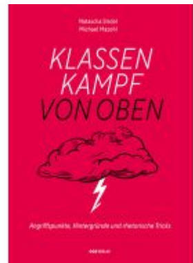
Klassenkampf von oben Ladenpreis: 29,90EUR