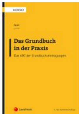
Das Grundbuch in der Praxis Ladenpreis: 27,00EUR