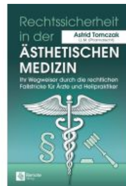
Rechtssicherheit in der ästhetischen Medizin Ladenpreis: 101,99EUR