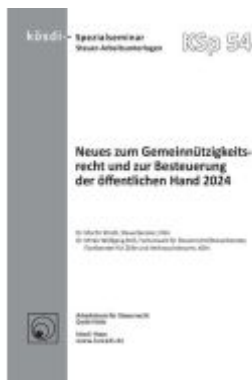
Gestaltende Steuerberatungspraxis 2024 Ladenpreis: 77,10EUR