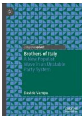
Brothers of Italy Ladenpreis: 54,99EUR