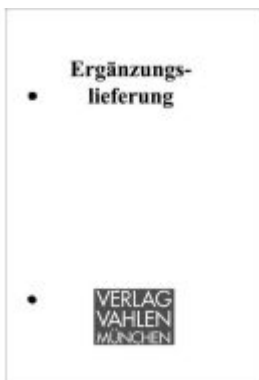
Städtebauförderungsrecht 76. Ergänzungslieferung Ladenpreis: 70,00EUR

Wir haben andere Produkte gefunden, die Ihnen gefallen könnten!