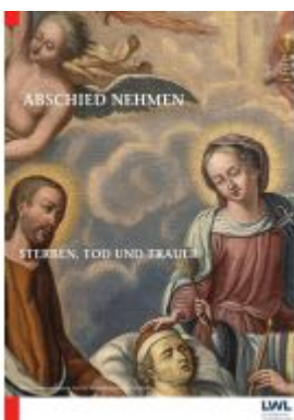
Abschied nehmen - Sterben, Tod und Trauer Ladenpreis: 14,40EUR