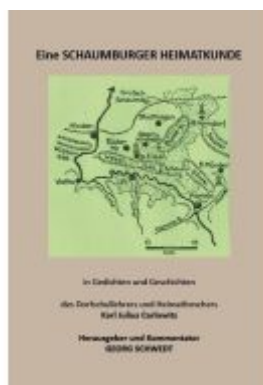
Eine SCHAUMBURGER HEIMATKUNDE Ladenpreis: 19,40EUR