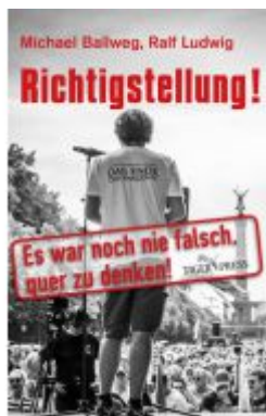
Richtigstellung! Ladenpreis: 24,70EUR