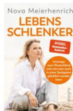
Lebensschlenker Ladenpreis: 20,60EUR