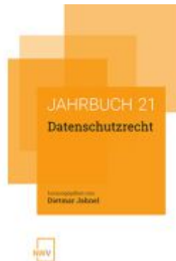
Datenschutzrecht Ladenpreis: 58,00EUR