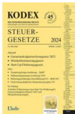
KODEX Steuergesetze 2024 Ladenpreis: 43,00EUR