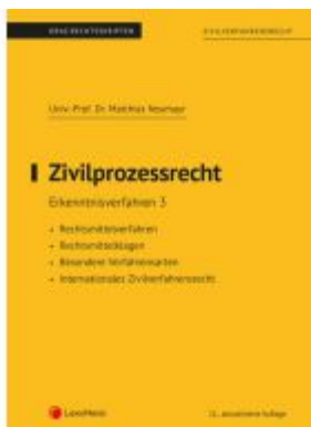
Zivilprozessrecht Erkenntnisverfahren 3 (Skriptum) Ladenpreis: 22,50EUR