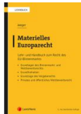
Materielles Europarecht Ladenpreis: 74,00EUR