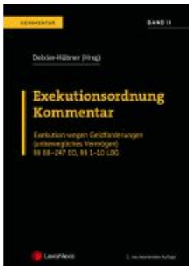
Exekutionsordnung - Kommentar Band 2 Ladenpreis: 214,00EUR

Wir haben andere Produkte gefunden, die Ihnen gefallen könnten!