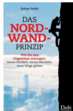
Das Nordwand-Prinzip Ladenpreis: 29,90EUR