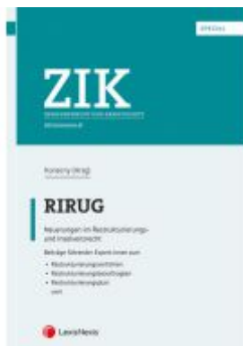
RIRUG Ladenpreis: 54,00EUR