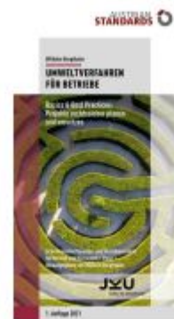
Umweltverfahren für Betriebe Ladenpreis: 27,50EUR