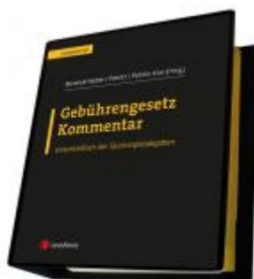
Gebührengesetz Kommentar Ladenpreis: 198,00 EUR