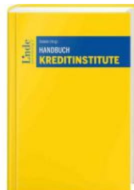
Handbuch Kreditinstitute Ladenpreis: 98,00 EUR