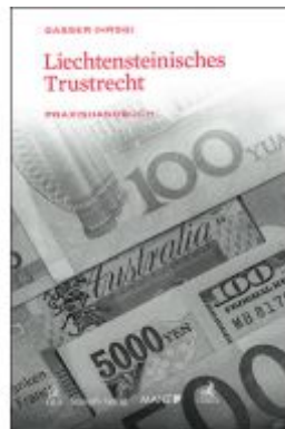
Liechtensteinisches Trustrecht Ladenpreis: 99,00 EUR