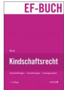
Kindschaftsrecht Ladenpreis: 168,00 EUR