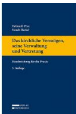
Das kirchliche Vermögen, seine Verwaltung und Vertretung Ladenpreis: 79,00 EUR