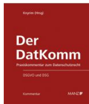
Der DatKomm Ladenpreis: 224,00 EUR