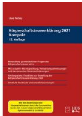
Körperschaftsteuererklärung 2021 Kompakt Ladenpreis: 113,00EUR