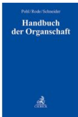
Handbuch der Organshaft Ladenpreis: 153,20EUR