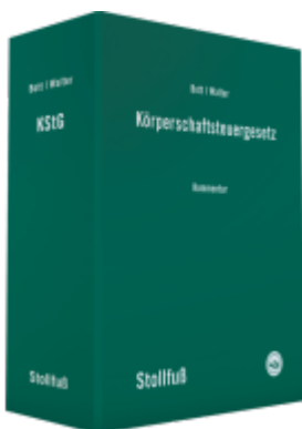
Körperschaftsteuergesetz Kommentar Ladenpreis: 988,90EUR