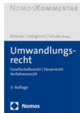
Umwandlungsrecht Ladenpreis: 235,50EUR