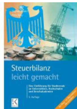
Steuerbilanz – leicht gemacht. Ladenpreis: 16,40EUR