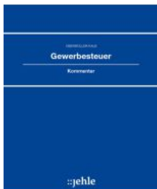
Gewerbsteuer Ladenpreis: 194,30EUR

Wir haben andere Produkte gefunden, die Ihnen gefallen könnten!