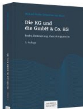
Die KG und die GmbH & Co. KG Ladenpreis: 123,40EUR