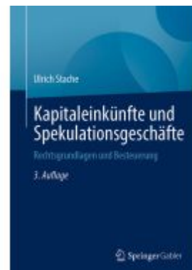
Kapitaleinkünfte und Spekulationsgeschäfte Ladenpreis: 56,53EUR