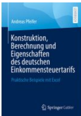
Konstruktion, Berechnung und Eigenschaften des deutschen Einkommensteuertarifs Ladenpreis: 23,63EUR