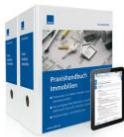
Praxishandbuch Immobilien Ladenpreis: 239,80EUR