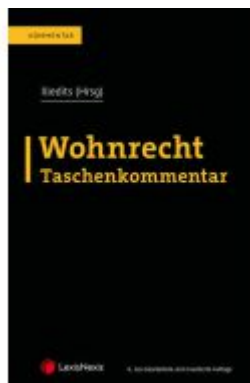
Wohnrecht Taschenkommentar Ladenpreis: 229,00EUR