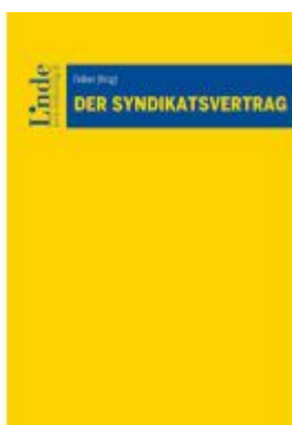
Der Syndikatsvertrag Ladenpreis: 55,00EUR