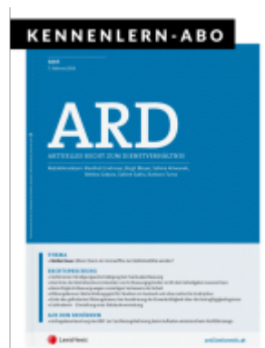
ARD Zeitschrift - Kennenlern-Abo (4 Hefte) Ladenpreis: 50,00EUR