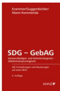
SDG - GebAG Sachverständigen- und DolmetscherG - GebührenanspruchsG Ladenpreis: 28,80EUR