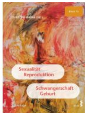
Sexualität, Reproduktion, Schwangerschaft, Geburt Ladenpreis: 29,50EUR