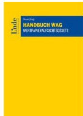
Handbuch WAG | Wertpapieraufsichtsgesetz Ladenpreis: 140,00EUR