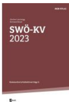
SWÖ-KV 2023 Ladenpreis: 12,90EUR