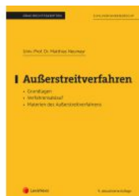
Außerstreitverfahren (Skriptum) Ladenpreis: 21,25EUR