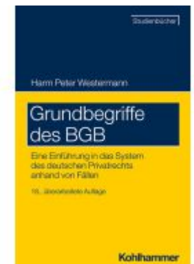
Grundbegriffe des BGB Ladenpreis: 29,90EUR