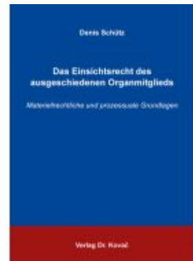
Das Einsichtsrecht des ausgeschiedenen Organmitglieds Ladenpreis: 91,40EUR