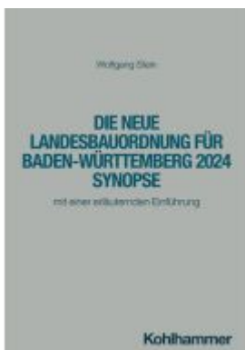
Die neue Landesbauordnung für Baden- Württemberg 2025 Synopse Ladenpreis: 25,70EUR