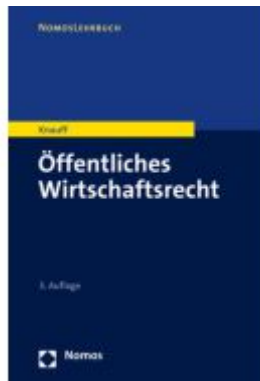
Öffentliches Wirtschaftsrecht Ladenpreis: 30,80EUR