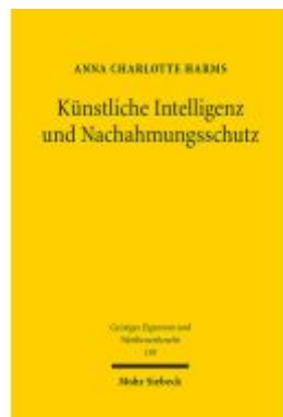
Künstliche Intelligenz und Nachahmungsschutz Ladenpreis: 81,30EUR