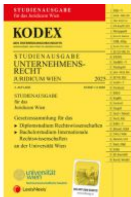
KODEX Unternehmensrecht Wien Juridicum 2025 - inkl. App Ladenpreis: 28,00EUR