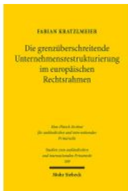
Die grenzüberschreitende Unternehmensrestrukturierung im europäischen Rechtsrahmen Ladenpreis: 101,80EUR