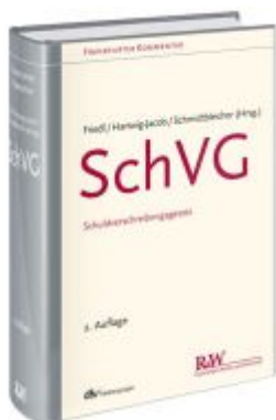
SchVG Ladenpreis: 153,20EUR