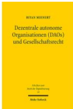
Dezentrale autonome Organisationen (DAOs) und Gesellschaftsrecht Ladenpreis: 86,40EUR