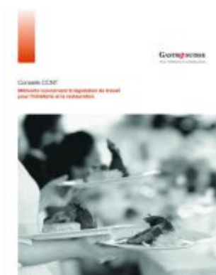
Conseils CCNT Ladenpreis: 128,00EUR