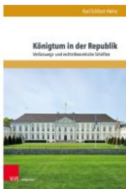
Königtum in der Republik Ladenpreis: 62,00EUR