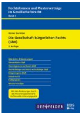
Die Gesellschaft bürgerlichen Rechts (GbR) Ladenpreis: 51,30EUR