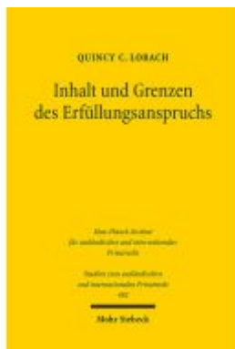
Inhalt und Grenzen des Erfüllungsanspruchs Ladenpreis: 86,40EUR