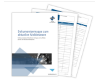
Dokumentenmappe zum aktuellen Meldewesen Ladenpreis: 119,90EUR