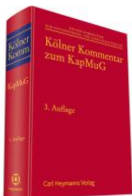
Kölner Kommentar zum KapMuG Ladenpreis: 173,80EUR