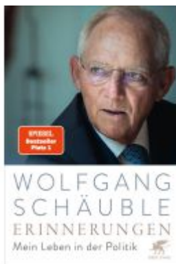
Erinnerungen Ladenpreis: 39,10EUR