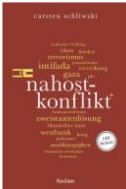
Nahostkonflikt. 100 Seiten