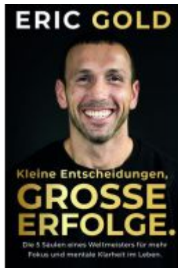
Kleine Entscheidungen, große Erfolge.