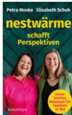
Nestwärme schafft Perspektiven Ladenpreis: 20,60EUR