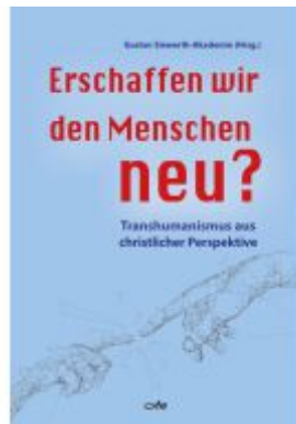
Erschaffen wir den Menschen neu?