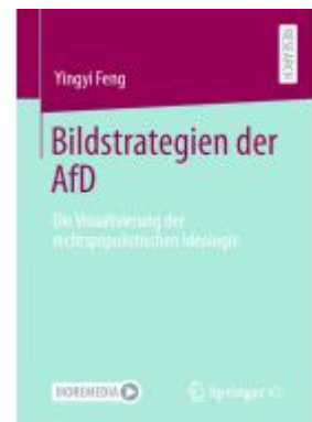
Bildstrategien der AfD Ladenpreis: 77,09EUR