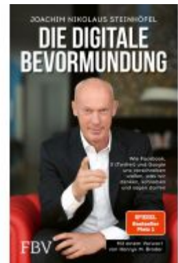
Die digitale Bevormundung Ladenpreis: 18,60EUR