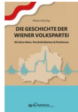
Die Geschichte der Wiener Volkspartei