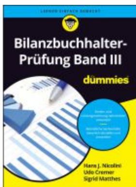
Bilanzbuchhalter-Prüfung Band III für Dummys Ladenpreis: 30,90EUR