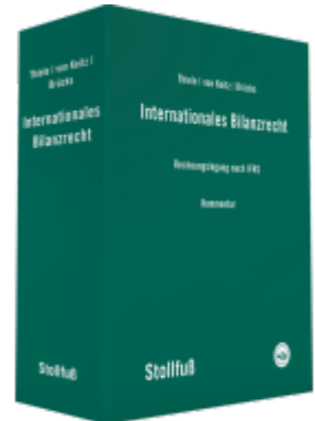
Internationales Bilanzrecht Kommentar Ladenpreis: 949,30EUR