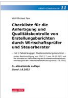
Checkliste 11 für die Anfertigung und Qualitätskontrolle von Erstellungsberichten durch Wirtschaftsprüfer und Steuerberater Ladenpreis: 65,80EUR