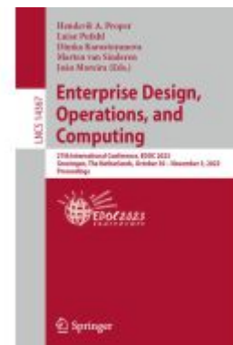
Enterprise Design, Operations, and Computing Ladenpreis: 63,79EUR