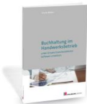
Buchhaltung im Handwerksbetrieb unter Einsatz branchenüblicher Software umsetzen Ladenpreis: 22,60EUR

Wir haben andere Produkte gefunden, die Ihnen gefallen könnten!