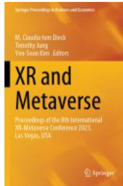
XR and Metaverse Ladenpreis: 186,99EUR