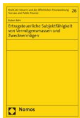
Ertragsteuerliche Subjektfähigkeit von Vermögensmassen und Zweckvermögen Ladenpreis: 101,80EUR