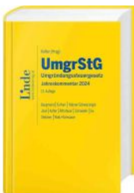
UmgrStG | Umgründungssteuergesetz 2024 Ladenpreis: 260,00EUR