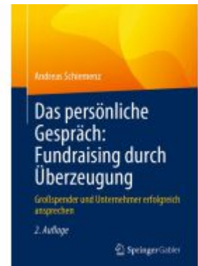
Das persönliche Gespräch: Fundraising durch Überzeugung Ladenpreis: 51,39EUR