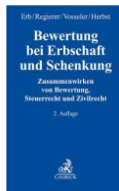
Bewertung bei Erbschaft und Schenkung Ladenpreis: 132,70EUR