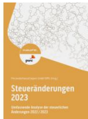
Steueränderungen 2023 Ladenpreis: 122,40EUR