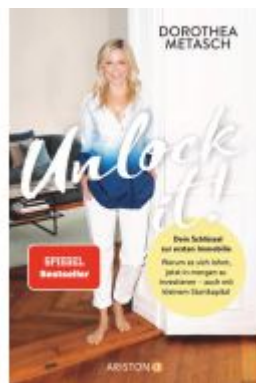
Unlock it! Ladenpreis: 20,60EUR