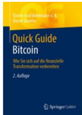
Quick Guide Bitcoin Ladenpreis: 30,83EUR