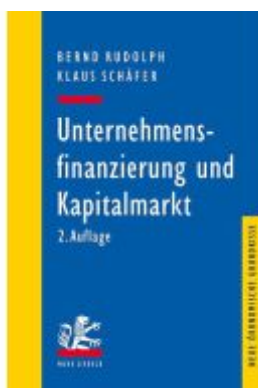
Unternehmensfinanzierung und Kapitalmarkt Ladenpreis: 41,20EUR