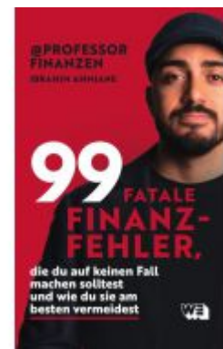
99 fatale Finanzfehler, die du auf keinen Fall machen solltest und wie du sie am besten vermeidest Ladenpreis: 16,00EUR