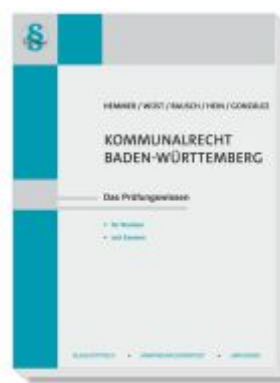
Kommunalrecht Baden-Württemberg Ladenpreis: 25,60EUR