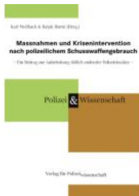
Massnahmen und Krisenintervention nach polizeilichem Schusswaffengebrauch Ladenpreis: 25,60EUR