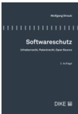
Softwareschutz Ladenpreis: 142,00EUR