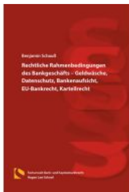
Rechtliche Rahmenbedingungen des Bankgeschäfts – Geldwäsche, Datenschutz, Bankenaufsicht, EU-Bankrecht, Kartellrecht Ladenpreis: 29,80EUR