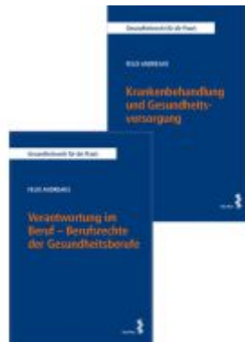
Kombipaket Verantwortung im Beruf – Berufsrechte der Gesundheitsberufe sowie Krankenbehandlung und Gesundheitsversorgung Ladenpreis: 59,00EUR