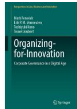
Organizing-for-Innovation Ladenpreis: 153,99EUR