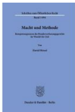
Macht und Methode. Ladenpreis: 82,20EUR