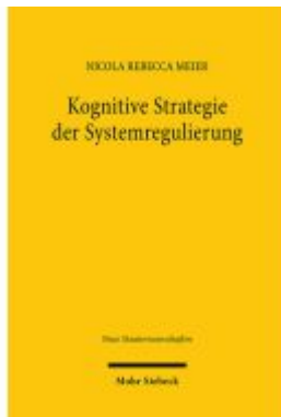
Kognitive Strategie der Systemregulierung Ladenpreis: 81,30EUR