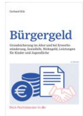
Bürgergeld Ladenpreis: 20,50EUR