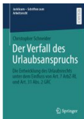
Der Verfall des Urlaubsanspruchs Ladenpreis: 102,79EUR