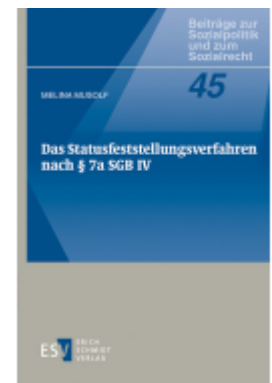
Das Statusfeststellungsverfahren nach § 7a SGB IV Ladenpreis: 37,10EUR