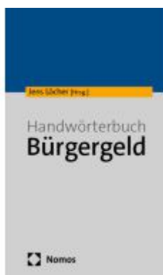
Handwörterbuch Bürgergeld Ladenpreis: 50,40EUR