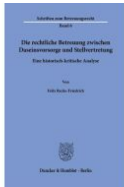
Die rechtliche Betreuung zwischen Daseinsvorsorge und Stellvertretung. Ladenpreis: 71,90EUR