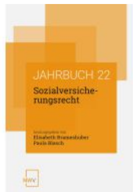
Sozialversicherungsrecht Ladenpreis: 68,00EUR