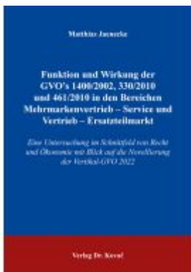
Funktionen und Wirkung der GVO's 1400 /2002, 330/2010 und 461/2010 in den Bereichen Mehrmarkenvertrieb – Service und Vertrieb – Ersatzteilmarkt Ladenpreis: 88,30EUR