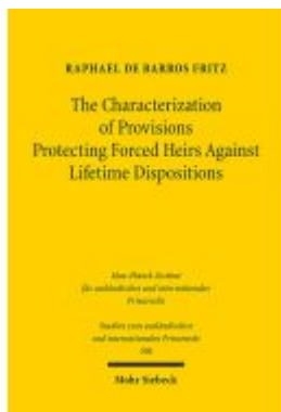
The Characterization of Provisions Protecting Forced Heirs Against Lifetime Dispositions Ladenpreis: 101,80EUR

Wir haben andere Produkte gefunden, die Ihnen gefallen könnten!