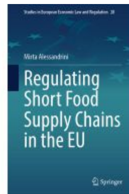
Regulating Short Food Supply Chains in the EU Ladenpreis: 142,99EUR