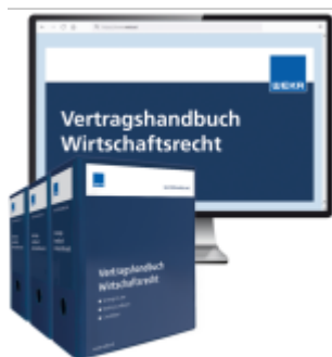
Vertragshandbuch Wirtschaftsrecht Ladenpreis: 283,80EUR