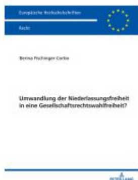
Umwandlung der Niederlassungsfreiheit in eine Gesellschaftsrechtswahlfreiheit? Ladenpreis: 51,40EUR