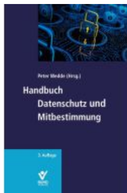
Handbuch Datenschutz und Mitbestimmung Ladenpreis: 65,80EUR