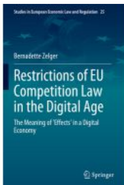
Restrictions of EU Competition Law in the Digital Age Ladenpreis: 164,99EUR