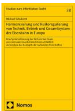
Harmonisierung und Risikoregulierung von Technik, Betrieb und Gesamtsystem der Eisenbahn in Europa Ladenpreis: 153,20EUR