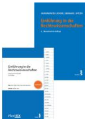
Kombipaket Einführung in die Rechtswissenschaften und FlexLex Einführung in die Rechtswissenschaften | Studium Ladenpreis: 36,00EUR