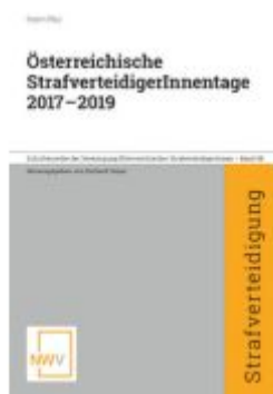
Österreichische StrafverteidigerInnenstage 2017 — 2019 Ladenpreis: 68,00EUR