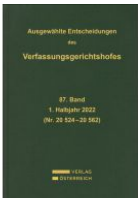
Ausgewählte Entscheidungen des Verfassungsgerichtshofes Ladenpreis: 459,00EUR