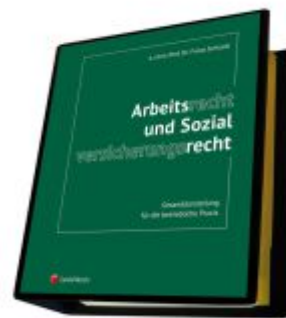
Arbeitsrecht und Sozialversicherungsrecht Ladenpreis: 373,00EUR