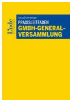
Praxisleitfaden GmbH- Generalversammlung Ladenpreis: 49,00EUR