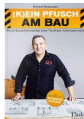
(K)ein Pfusch am Bau Ladenpreis: 34,00EUR