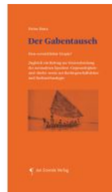
Der Gabentausch Ladenpreis: 24,90EUR