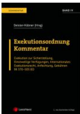
Exekutionsordnung - Kommentar Band 4 Ladenpreis: 164,00EUR