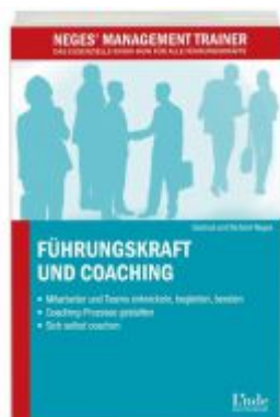
Führungskraft und Coaching Ladenpreis: 15,40 EUR