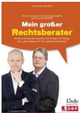
Mein großer Rechtsberater Ladenpreis: 29,90 EUR

Wir haben andere Produkte gefunden, die Ihnen gefallen könnten!