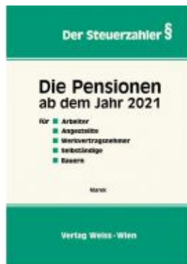
Die Pensionen ab dem Jahr 2021 Ladenpreis: 47,30 EUR