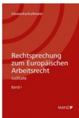
Rechtsprechung zum Europäischen Arbeitsrecht Ladenpreis: 64,00 EUR