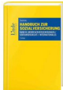
Handbuch zur Sozialversicherung Ladenpreis: 42,00 EUR