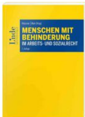
Menschen mit Behinderung im Arbeits- und Sozialrecht Ladenpreis: 35,00 EUR