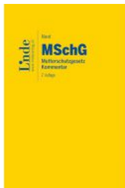
MSchG | Mutterschutzgesetz Ladenpreis: 69,00 EUR