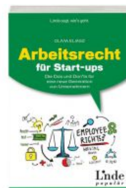
Arbeitsrecht für Start-ups Ladenpreis: 24,90 EUR