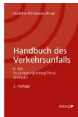
Handbuch des Verkehrsunfalls Zivilrecht Ladenpreis: 198,00EUR