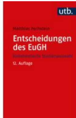
Entscheidungen des EuGH Ladenpreis: 32,90EUR