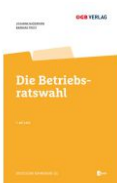
Die Betriebsratswahl Ladenpreis: 69,00EUR

Wir haben andere Produkte gefunden, die Ihnen gefallen könnten!