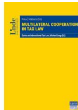
Multilateral Cooperation in Tax Law Ladenpreis: 98,00EUR