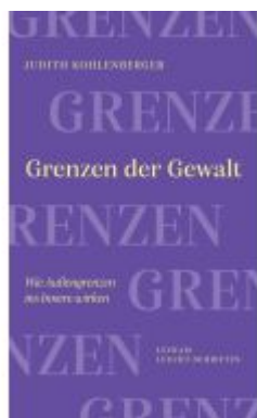
Grenzen der Gewalt Ladenpreis: 16,50EUR