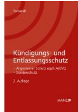
Kündigungs- und Entlassungsschutz Ladenpreis: 42,00EUR