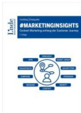
#marketinginsights Ladenpreis: 39,00EUR