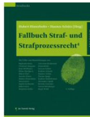
Fallbuch Straf- und Strafprozessrecht Ladenpreis: 42,50 EUR