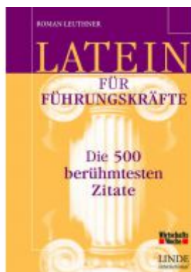
Latein für Führungskräfte Ladenpreis: 18,50 EUR