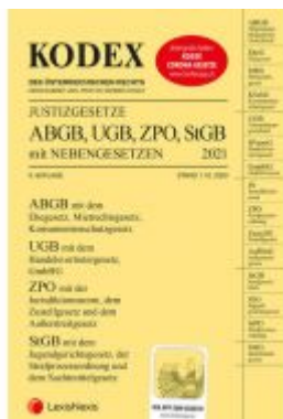
KODEX Justizgesetze 2021 Ladenpreis: 29,00 EUR

Wir haben andere Produkte gefunden, die Ihnen gefallen könnten!