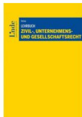
Lehrbuch Zivil-, Unternehmens- und Gesellschaftsrecht Ladenpreis: 44,00 EUR