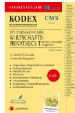
KODEX Wirtschaftsprivatrecht Klagenfurt Ladenpreis: 23,00 EUR