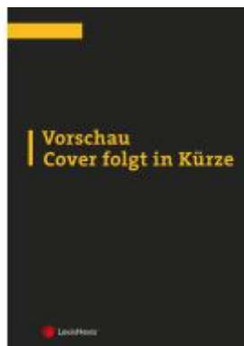
ABGB Praxiskommentar / ABGB Praxiskommentar - Band 8, 5. Auflage Aktionspreis: 160,00EUR Ladenpreis: 200,00EUR