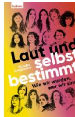
Laut und selbstbestimmt Ladenpreis: 22,00EUR