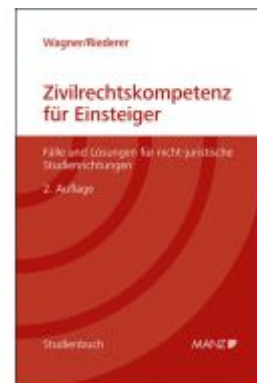
Zivilrechtskompetenz für Einsteiger Fälle und Lösungen für nicht-juristische Studienrichtungen Ladenpreis: 34,40EUR