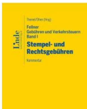
Fellner Gebühren und Verkehrssteuern, Band I: Stempel- und Rechtsgebühren Ladenpreis: 132,00EUR