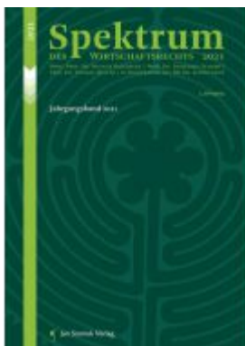
Spektrum des Wirtschaftsrechts Ladenpreis: 78,00EUR

Wir haben andere Produkte gefunden, die Ihnen gefallen könnten!