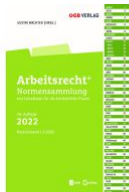
Arbeitsrecht+ Ladenpreis: 59,00EUR