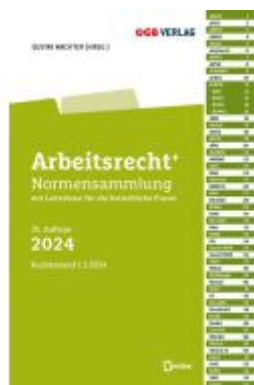
Arbeitsrecht+ Ladenpreis: 65,00EUR