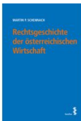
Rechtsgeschichte der österreichischen Wirtschaft Ladenpreis: 38,00EUR