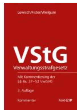
Verwaltungsstrafgesetz - VStG Ladenpreis: 138,00EUR