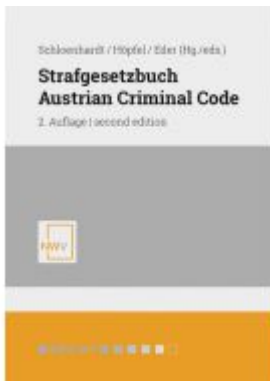
Strafgesetzbuch / Austrian Criminal Code Ladenpreis: 98,00 EUR

Wir haben andere Produkte gefunden, die Ihnen gefallen könnten!