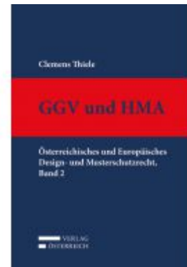
GGV und HMA Ladenpreis: 329,00 EUR