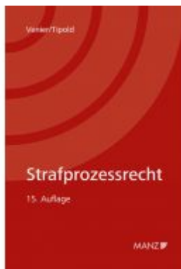
Strafprozessrecht Ladenpreis: 39,00 EUR