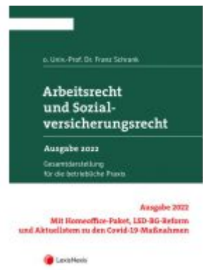
Arbeitsrecht und Sozialversicherungsrecht 2022 Ladenpreis: 348,00 EUR