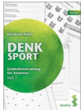
Denksport Ladenpreis: 14,90 EUR