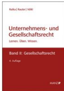
Unternehmens- und Gesellschaftsrecht Ladenpreis: 63,00 EUR