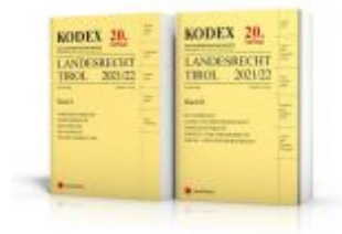
KODEX Landesrecht Tirol 2021 Ladenpreis: 128,00 EUR