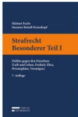
Strafrecht Besonderer Teil I Ladenpreis: 35,00 EUR