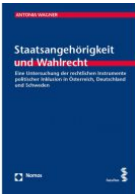
Staatsangehörigkeit und Wahlrecht Ladenpreis: 73,90 EUR