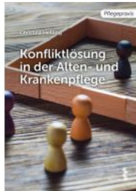
Konfliktlösung in der Pflege Ladenpreis: 9,90 EUR