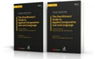
Angloamerikanische Rechtssprache / PAKET: The Practitioners' Guide to Applied Comparative Law and Language Ladenpreis: 142,40 EUR