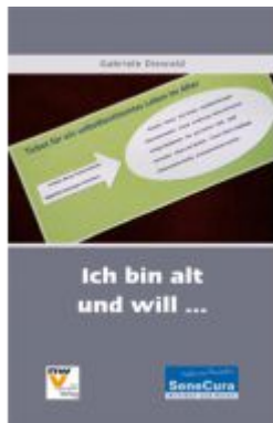
Ich bin alt und will ... Ladenpreis: 24,80 EUR