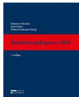
Bundesvergabegesetz 2018 Ladenpreis: 899,00 EUR