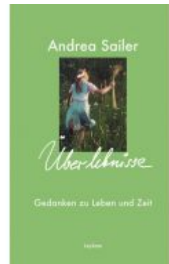
Überlebense – Gedanken zu Leben und Zeit Ladenpreis: 18,50 EUR