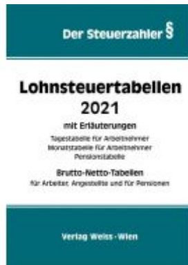
Lohnsteuertabellen 2021 Ladenpreis: 34,10 EUR