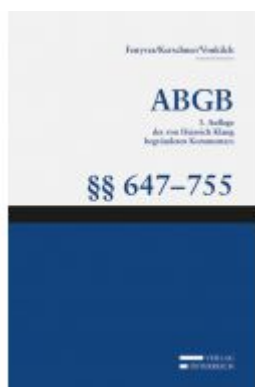
Großkommentar zum ABGB - Klang Kommentar Aktionspreis: 232,90 EUR Ladenpreis: 274,00 EUR