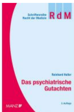
Das psychiatrische Gutachten Ladenpreis: 78,00 EUR