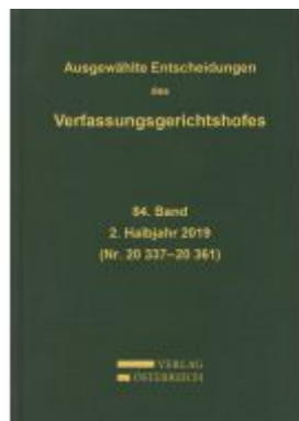
Ausgewählte Entscheidungen des Verfassungsgerichtshofes Ladenpreis: 299,00 EUR