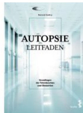
Autopsie Leitfaden Ladenpreis: 29,90 EUR