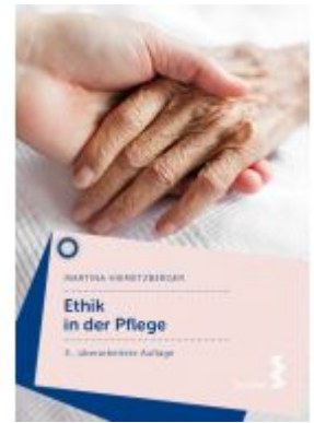
Ethik in der Pflege Ladenpreis: 19,90 EUR