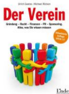
Der Verein Ladenpreis: 12,90 EUR

Wir haben andere Produkte gefunden, die Ihnen gefallen könnten!