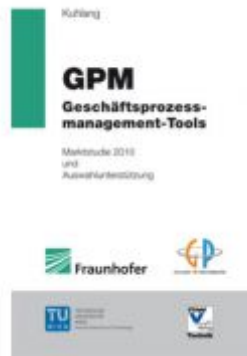
Geschäftsprozessmanagement-Tools Ladenpreis: 34,00 EUR