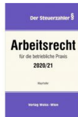
Arbeitsrecht für die betriebliche Praxis 2020/21 Ladenpreis: 85,80 EUR