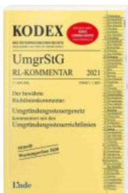
KODEX Umgründungssteuergesetz- Richtlinienkommentar 2021 Ladenpreis: 60,00 EUR