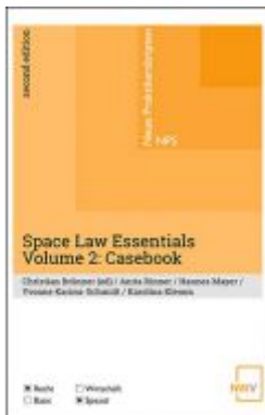
Space Law Essentials Ladenpreis: 19,00 EUR