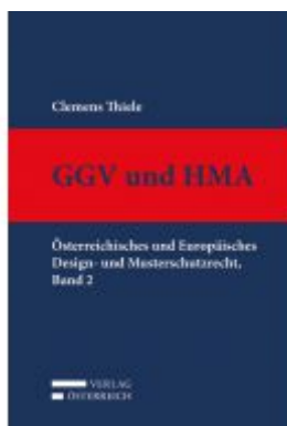
GGV und HMA Ladenpreis: 329,00 EUR