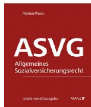
Allgemeine Sozialversicherung ASVG Ladenpreis: 338,00 EUR