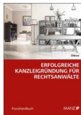
Erfolgreiche Kanzlei Gründung für Rechtsanwälte Ladenpreis: 34,00 EUR