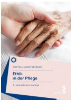
Ethik in der Pflege Ladenpreis: 19,90 EUR

Wir haben andere Produkte gefunden, die Ihnen gefallen könnten!