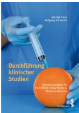
Durchführung klinischer Studien Ladenpreis: 9,90 EUR