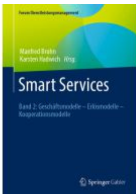
Smart Services Ladenpreis: 174,76EUR