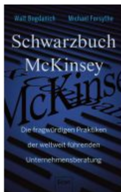
Schwarzbuch McKinsey Ladenpreis: 25,70EUR