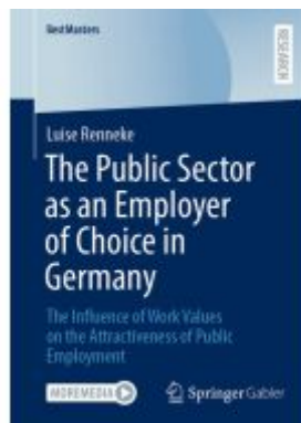
The Public Sector as an Employer of Choice in Germany Ladenpreis: 98,99EUR