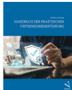
Handbuch der praktischen Unternehmensführung Ladenpreis: 46,00EUR