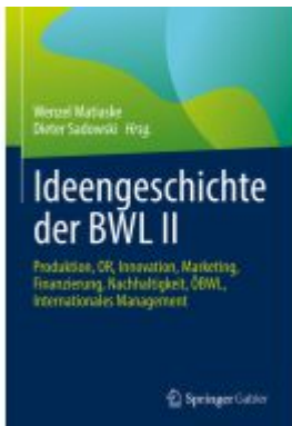
Ideengeschichte der BWL II Ladenpreis: 77,09EUR

Wir haben andere Produkte gefunden, die Ihnen gefallen könnten!