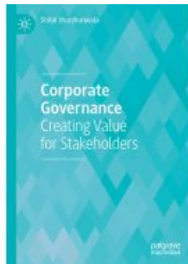
Corporate Governance Ladenpreis: 65,99EUR