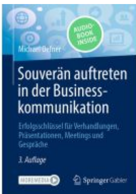
Souverän auftreten in der Businesskommunikation Ladenpreis: 28,77EUR