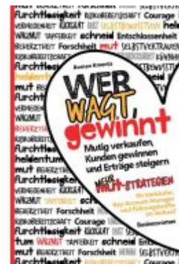
Wer wagt, gewinnt Ladenpreis: 19,97EUR