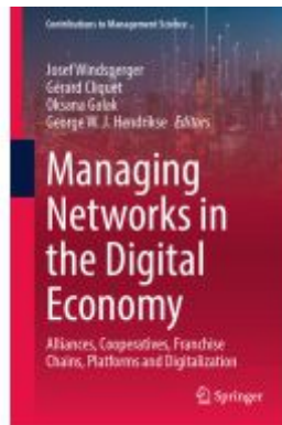
Managing Networks in the Digital Economy