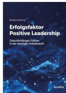
Erfolgsfaktor Positive Leadership Ladenpreis: 26,90EUR