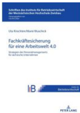
Strategien des Personalmanagements zur Fachkräftesicherung in sächsischen Unternehmen für eine Arbeitswelt 4.0 Ladenpreis: 61,60EUR