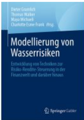
Modellierung von Wasserrisiken