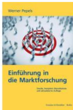
Einführung in die Marktforschung.