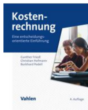
Kostenrechnung Ladenpreis: 41,00EUR