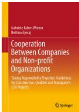
Cooperation Between Companies and Non-profit Organizations Ladenpreis: 76,99EUR