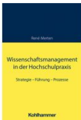
Wissenschaftsmanagement in der Hochschulpraxis Ladenpreis: 32,90EUR