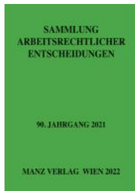
Sammlung arbeitsrechtlicher Entscheidungen Ladenpreis: 98,00EUR