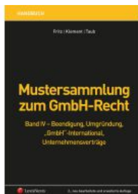
Mustersammlung zum GmbH-Recht / Mustersammlung zum GmbH-Recht, Band IV - Beendigung, Umgründung, "GmbH" international, Unternehmensverträge Ladenpreis: 299,00EUR