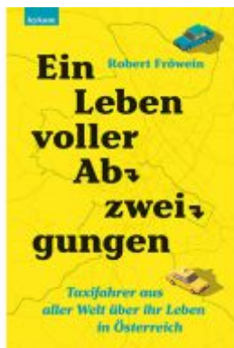
Ein Leben voller Abzweigungen. Ladenpreis: 22,00EUR