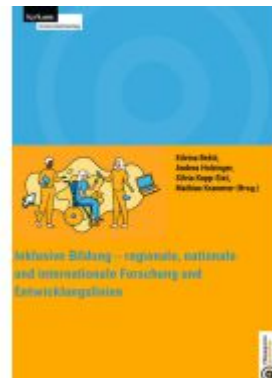
Inklusive Bildung - regionale, nationale und internationale Forschung und Entwicklungslinien Ladenpreis: 31,00EUR