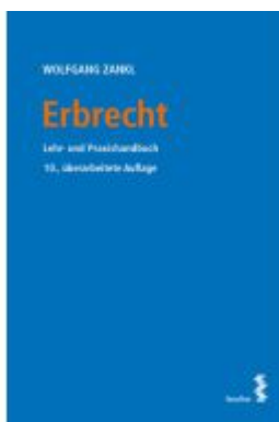
Erbrecht Ladenpreis: 29,00EUR