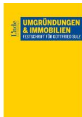
Umgründungen und Immobilien Ladenpreis: 65,00EUR