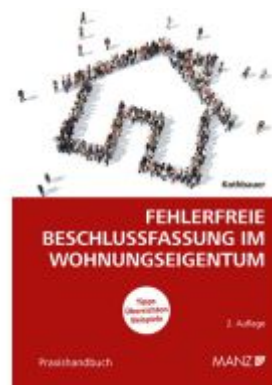
Fehlerfreie Beschlussfassung im Wohnungseigentum Ladenpreis: 32,00EUR