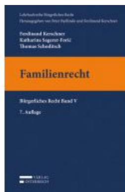
Familienrecht Ladenpreis: 28,00 EUR