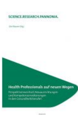
Health Professionals auf neuen Wegen Ladenpreis: 18,50 EUR