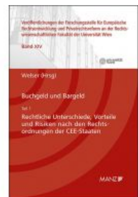
Buchgeld und Bargeld - Teil 1: Rechtliche Unterschiede und Risiken nach den Rechtsordnungen der CEE-Staaten Ladenpreis: 64,00 EUR