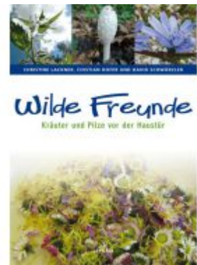
Wilde Freunde Ladenpreis: 14,90 EUR