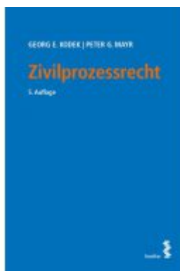
Zivilprozessrecht Ladenpreis: 39,00 EUR