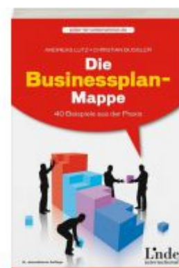
Die Businessplan-Mappe Ladenpreis: 19,90 EUR