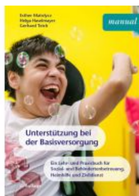
Unterstützung bei der Basisversorgung Ladenpreis: 22,90 EUR