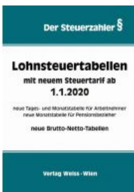
Lohnsteuertabellen mit neuem Steuertarif ab 1.1.2020 Ladenpreis: 34,10 EUR