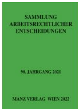
Sammlung arbeitsrechtlicher Entscheidungen Ladenpreis: 98,00 EUR