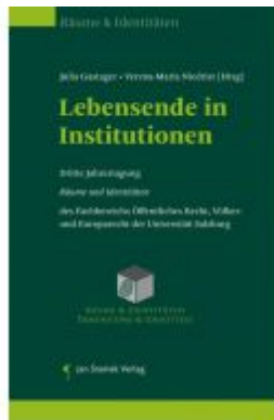
Lebenseinde in Institutionen Ladenpreis: 55,00 EUR