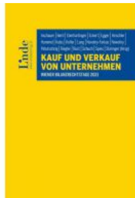
Kauf und Verkauf von Unternehmen Ladenpreis: 68,00 EUR