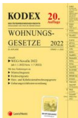
KODEX Wohnungsgesetze 2022 - inkl. App Ladenpreis: 56,00 EUR