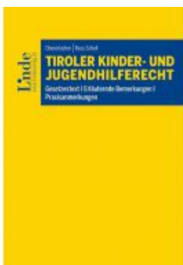
Tiroler Kinder- und Jugendhilferecht Ladenpreis: 39,00 EUR