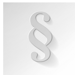
Quantitative Aspekte des Ausdauertrainings Ladenpreis: 18,60 EUR