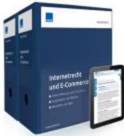
Internetrecht und E-Commerce Ladenpreis: 261,80 EUR