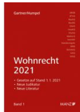
Wohnrecht 2021 Ladenpreis: 44,00 EUR