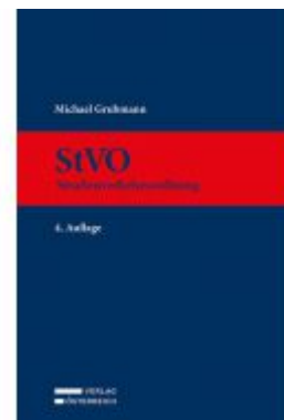
StVO Ladenpreis: 349,00 EUR