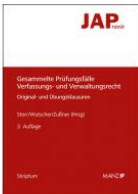
JAP Gesammelte Prüfungsfälle Verfassungs- und Verwaltungsrecht Ladenpreis: 33,00 EUR

Wir haben andere Produkte gefunden, die Ihnen gefallen könnten!