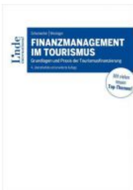
Finanzmanagement im Tourismus Ladenpreis: 50,00 EUR