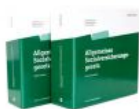
Allgemeines Sozialversicherungsgesetz Ladenpreis: 128,00 EUR