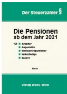
Die Pensionen ab dem Jahr 2021 Ladenpreis: 47,30 EUR