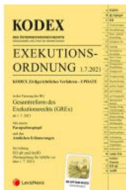
Kodex Exekutionsordnung - GREx - inkl. App Ladenpreis: 22,00 EUR