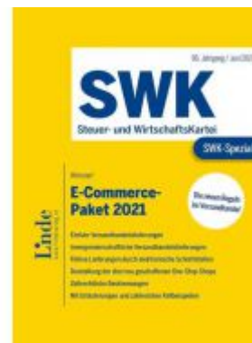
SWK-Spezial E-Commerce-Paket 2021 Ladenpreis: 39,00 EUR