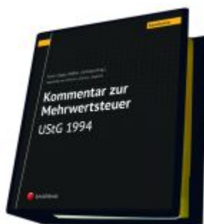
Kommentar zur Mehrwertsteuer - UStG 1994 Ladenpreis: 825,00EUR

Wir haben andere Produkte gefunden, die Ihnen gefallen könnten!