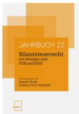
Bilanzsteuerrecht mit Bezügen zum UGB und KStG Ladenpreis: 62,00EUR