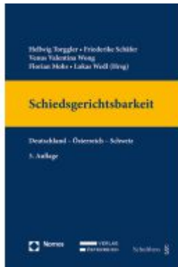
Schiedsgerichtsbarkeit Ladenpreis: 189,00EUR