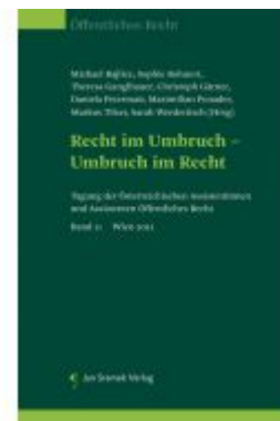
Recht im Umbruch - Umbruch im Recht Ladenpreis: 85,00EUR