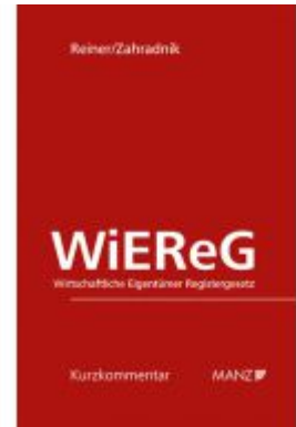
Wirtschaftliche Eigentümer Registergesetz WiEReG Ladenpreis: 98,00EUR