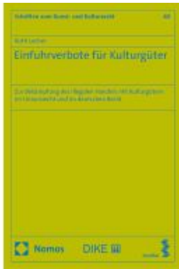
Einfuhrverbote für Kulturgüter Ladenpreis: 199,50EUR