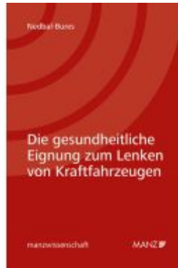
Die gesundheitliche Eignung zum Lenken von Kraftfahrzeugen Ladenpreis: 74,00EUR