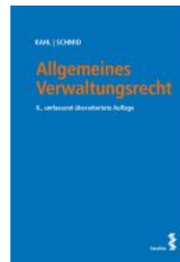
Allgemeines Verwaltungsrecht Ladenpreis: 38,00EUR