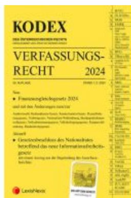
KODEX Verfassungsrecht 2024 - inkl. App Ladenpreis: 43,80EUR