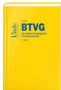
BTVG | Bauträgervertragsgesetz Ladenpreis: 78,00EUR