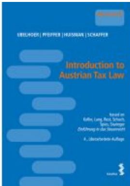
Introduction to Austrian Tax Law Ladenpreis: 28,00EUR