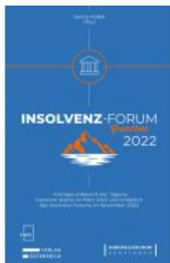
Insolvenz-Forum 2022 Ladenpreis: 78,00EUR