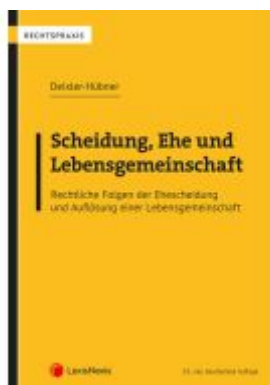
Scheidung, Ehe und Lebensgemeinschaft Ladenpreis: 79,00EUR