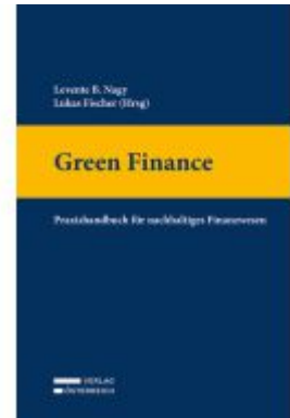
Green Finance Ladenpreis: 69,00EUR