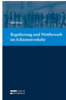
Regulierung und Wettbewerb im Schienenverkehr Ladenpreis: 74,00EUR