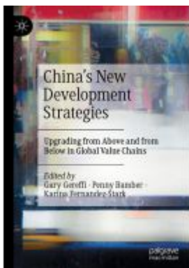
China's New Development Strategies Ladenpreis: 109,99EUR

Wir haben andere Produkte gefunden, die Ihnen gefallen könnten!