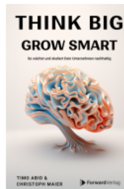
Think Big, Grow Smart Ladenpreis: 25,90EUR