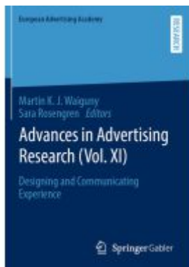
Advances in Advertising Research (Vol. XI) Ladenpreis: 164,99EUR