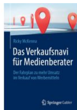
Das Verkaufsnavi für Medienberater Ladenpreis: 39,05EUR