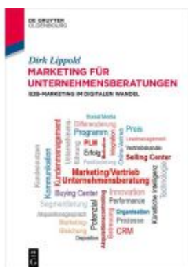
Marketing für Unternehmensberatungen Ladenpreis: 24,95EUR