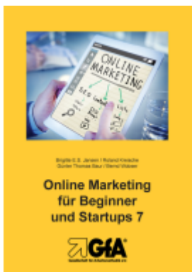
Online Marketing für Beginner und Startups 7 Ladenpreis: 15,30EUR