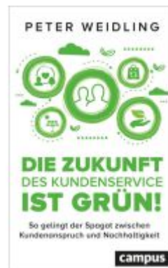
Die Zukunft des Kundenservice ist grün! Ladenpreis: 41,20EUR