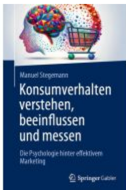
Konsumverhalten verstehen, beeinflussen und messen Ladenpreis: 56,53EUR