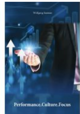
Performance.Culture.Focus Ladenpreis: 7,20EUR