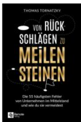
Von Rückschlägen zu Meilensteinen Ladenpreis: 24,90EUR