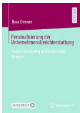
Personalisierung der Unternehmensberichterstattung Ladenpreis: 82,23EUR