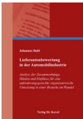
Lieferantenbewertung in der Automobilindustrie Ladenpreis: 102,60EUR