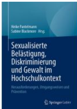
Sexualisierte Belästigung, Diskriminierung und Gewalt im Hochschulkontext Ladenpreis: 56,53EUR

Wir haben andere Produkte gefunden, die Ihnen gefallen könnten!