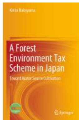
A Forest Environment Tax Scheme in Japan Ladenpreis: 120,99EUR