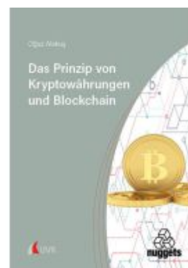
Das Prinzip von Kryptowährungen und Blockchain Ladenpreis: 20,50EUR