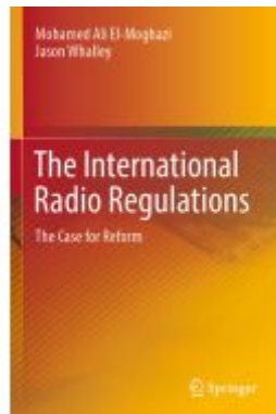
The International Radio Regulations Ladenpreis: 120,99EUR