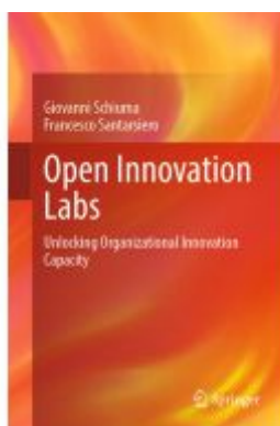
Open Innovation Labs Ladenpreis: 109,99EUR