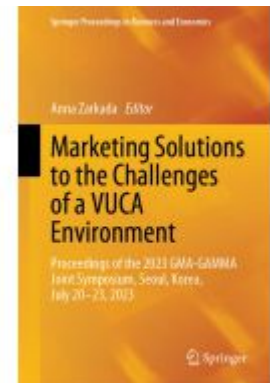
Marketing Solutions to the Challenges of a VUCA Environment Ladenpreis: 241,99EUR