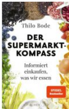
Der Supermarkt-Kompass Ladenpreis: 22,70EUR

Wir haben andere Produkte gefunden, die Ihnen gefallen könnten!