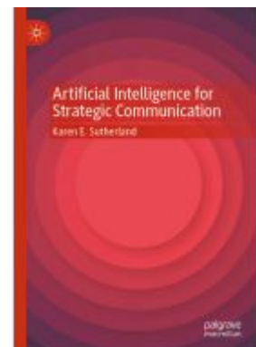
Artificial Intelligence for Strategic Communication Ladenpreis: 109,99EUR