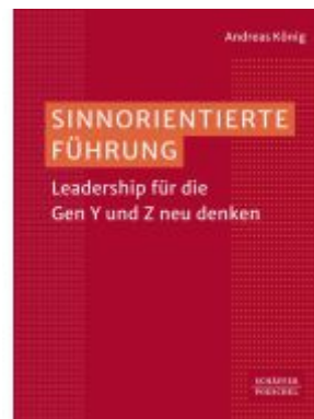
Sinnorientierte Führung Ladenpreis: 51,40EUR