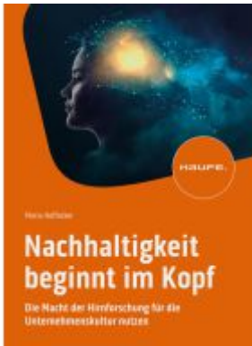
Nachhaltigkeit beginnt im Kopf Ladenpreis: 41,20EUR