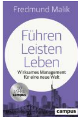
Führen Leisten Leben Ladenpreis: 25,70EUR