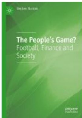
The People's Game? Ladenpreis: 175,99EUR