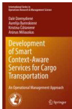
Development of Smart Context-Aware Services for Cargo Transportation Ladenpreis: 109,99EUR