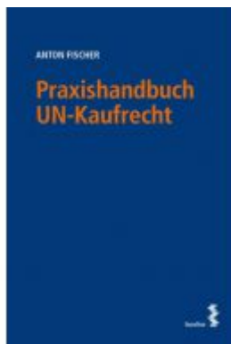
Praxishandbuch UN-Kaufrecht Ladenpreis: 48,00 EUR