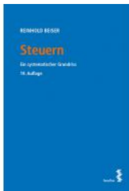
Steuern Ladenpreis: 49,00 EUR

Wir haben andere Produkte gefunden, die Ihnen gefallen könnten!