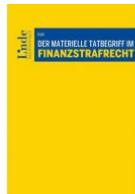
Der materielle Tatbegriff im Finanzstrafrecht Ladenpreis: 62,00 EUR