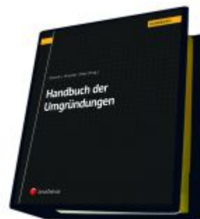
Handbuch der Umgründungen Ladenpreis: 450,00 EUR