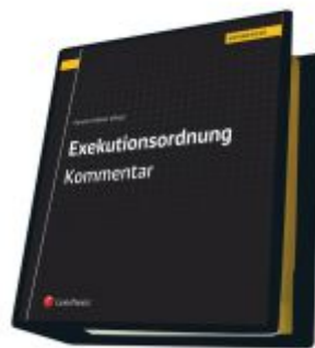
Exekutionsordnung - Kommentar Ladenpreis: 623,00 EUR