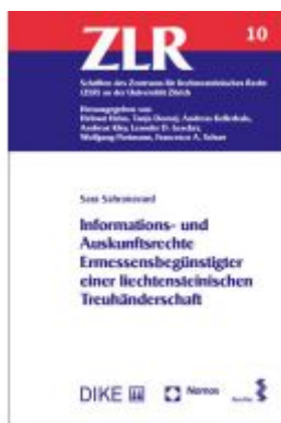
Informations- und Auskunftsrechte Ermessensbegünstigter einer liechtensteinischen Treuhänderschaft Ladenpreis: 92,50 EUR