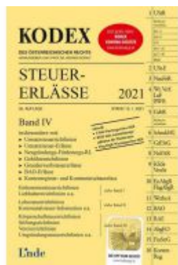
KODEX Steuer-Erlässe 2021, Band IV Ladenpreis: 61,00 EUR