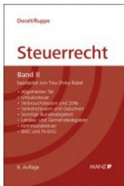
Grundriss des österreichischen Steuerrechts Ladenpreis: 68,00 EUR