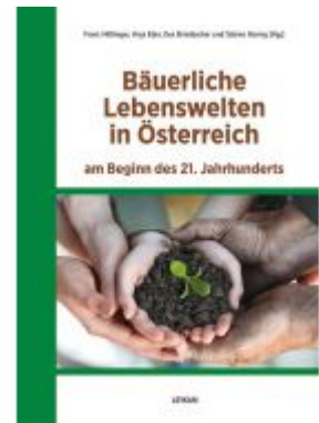
Bäuerliche Lebenswelten in Österreich am Beginn des 21. Jahrhunderts Ladenpreis: 24,00 EUR