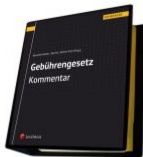
Gebührengesetz Kommentar Ladenpreis: 198,00 EUR