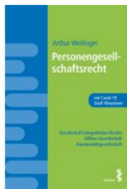
Personengesellschaftsrecht Ladenpreis: 24,00 EUR