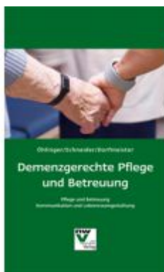
Demenzgerechte Pflege und Betreuung Ladenpreis: 29,80 EUR