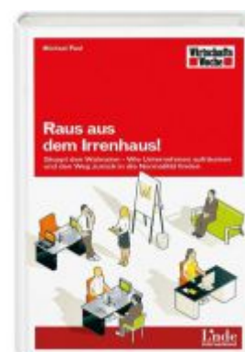
Raus aus dem Irrenhaus! Ladenpreis: 19,90 EUR