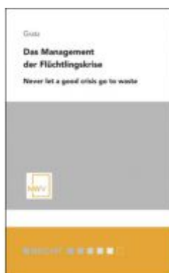
Das Management der Flüchtlingskrise Ladenpreis: 29,80 EUR