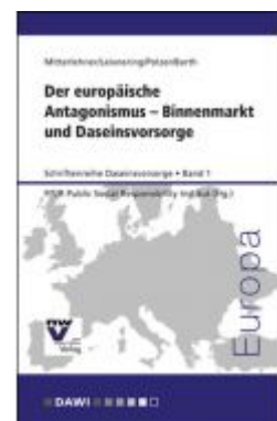
Der europäische Antagonismus – Binnenmarkt und Daseinsvorsorge Ladenpreis: 36,00 EUR