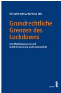
Grundrechtliche Grenzen des Lockdowns Ladenpreis: 28,00EUR