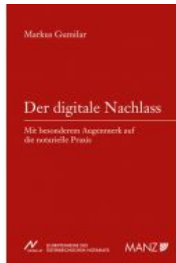
Der digitale Nachlass Ladenpreis: 54,00EUR