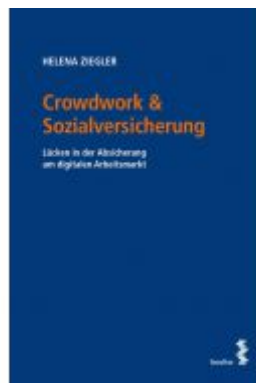
Crowdwork & Sozialversicherung Ladenpreis: 24,00EUR