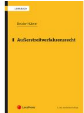
Außerstreitverfahrensrecht Ladenpreis: 26,00EUR