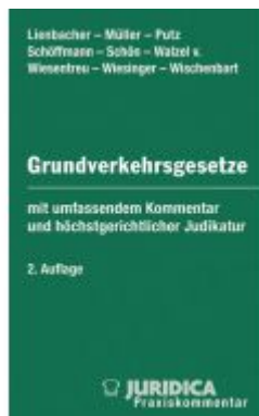
Die Grundverkehrsgesetze der österreichischen Bundesländer Ladenpreis: 225,00EUR