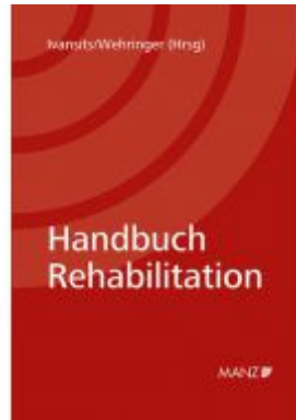
Handbuch Rehabilitation Ladenpreis: 79,00EUR