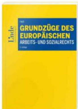
Grundzüge des europäischen Arbeits- und Sozialrechts Ladenpreis: 34,00EUR