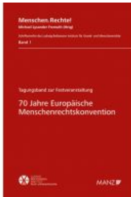
70 Jahre Europäische Menschenrechtskonvention Ladenpreis: 42,00EUR