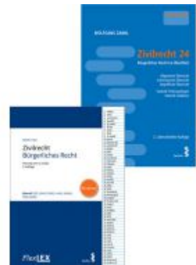
Kombipaket Zivilrecht 24 und FlexLex Zivilrecht/Bürgerliches Recht | Studium Ladenpreis: 39,00EUR