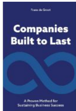
Companies Built to Last