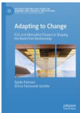
Adapting to Change Ladenpreis: 164,99EUR