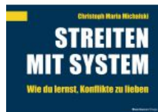
Streiten mit System Ladenpreis: 27,80EUR