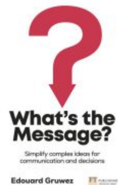
What's the Message? Simplify complex ideas for communication and decisions Ladenpreis: 22,89EUR