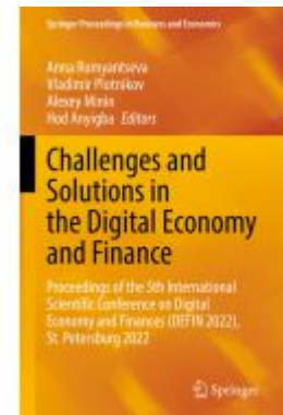
Challenges and Solutions in the Digital Economy and Finance Ladenpreis: 252,99EUR