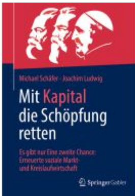
Mit Kapital die Schöpfung retten