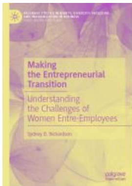
Making the Entrepreneurial Transition Ladenpreis: 164,99EUR