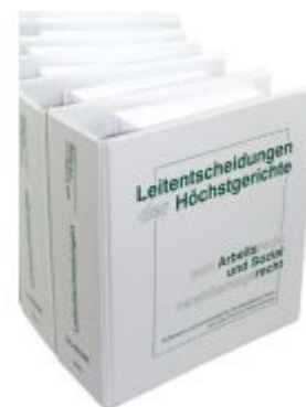
Leitentscheidungen der Höchstgerichte zum Arbeitsrecht und Sozialversicherungsrecht Ladenpreis: 1.360,00EUR