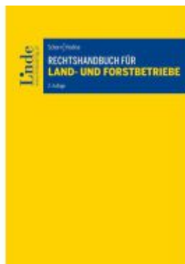
Rechtshandbuch für Land- und Forstbetriebe Ladenpreis: 58,00EUR