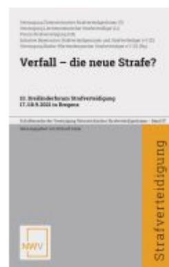
Verfall - die neue Strafe?