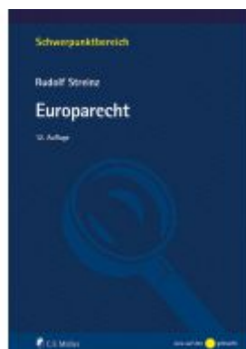
Europarecht Ladenpreis: 28,80EUR