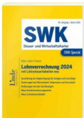
SWK-Spezial Lohnverrechnung 2024