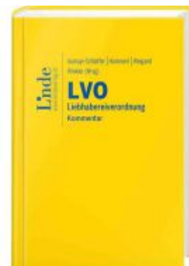
LVO | Liebhabereiverordnung Ladenpreis: 79,00EUR