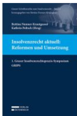
Insolvenzrecht aktuell: Reformen und Umsetzung Ladenpreis: 59,00EUR