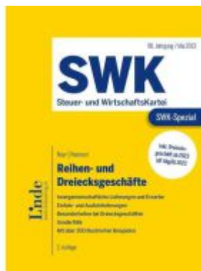
SWK-Spezial Reihen- und Dreiecksgeschäfte Ladenpreis: 48,00EUR

Wir haben andere Produkte gefunden, die Ihnen gefallen könnten!